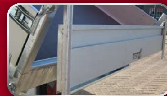
Achterbord boven en onder scharnierend