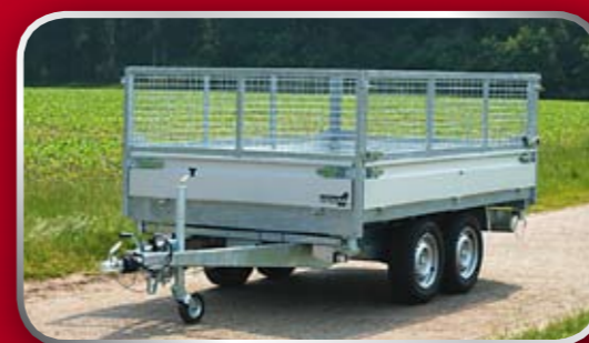
Loofrekken 60 cm hoog