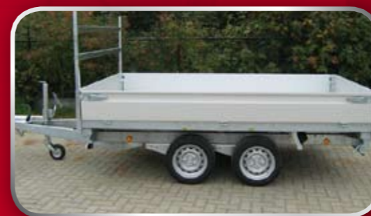
Vloer op 71 cm (d.m.v. 195/50R13 wielen)