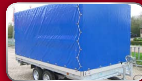
Huif + zeil 180 cm hoog, 3 zijden te openen