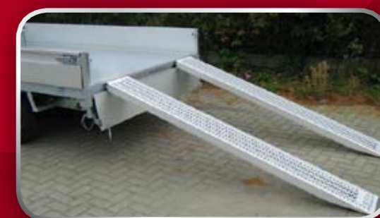
Aluminium rijplaten 240 x 30 cm