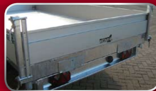
Achterbord boven en onder scharnierend